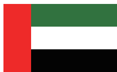
阿拉伯联合酋长国

阿联酋位于阿拉伯半岛东部，2022年人口约944.1万，人均GDP约5.4万美元。根据世界银行标准划分，属于高收入国家。阿联酋政府在发展石化工业的同时，把发展多样化经济、扩大贸易和增加非石油收入在国内生产总值中的比重作为重要任务。