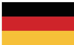
德意志联邦共和国

德国位于欧洲中部，2022年人口8410万，人均GDP约4.9万美元。根据世界银行标准划分，属于高收入国家。从中长期来看，德国工业基础雄厚，基础设施完善，劳动力素质较高，法律制度健全，营商环境投资环境较好，未来经济前景稳定。