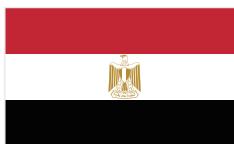
阿拉伯埃及共和国

埃及地处亚欧非三大洲交界处，2022年人口约1.1亿，人均GDP为4295.4美元。根据世界银行标准划分，属于中低等收入国家。埃及拥有相对完整的工业、农业和服务业体系，天然气、旅游、侨汇和苏伊士运河是四大外汇收入来源。