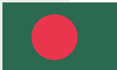
孟加拉人民共和国

孟加拉国位于南亚次大陆东北部，2023年人口约1.7亿，人均GDP为2529.1美元。根据世界银行标准划分，属于中低收入国家。孟加拉国消费市场潜力较大，劳动力资源丰富，成衣制造业是其经济支柱产业。