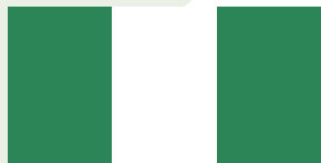
尼日利亚联邦共和国

尼日利亚位于西非东南部，2023年人口约2.2亿，人均GDP为1621.1美元。根据世界银行标准划分，属于中低收入国家。尼日利亚是非洲主要产油国，自然资源丰富，土地肥沃，人口众多，市场潜力大。