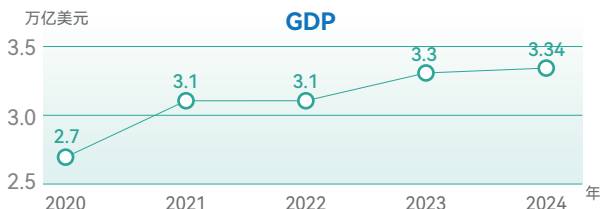
注：数据来源于世界银行，2024年为预测数据。