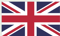
大不列颠及 北爱尔兰联合王国

英国位于欧洲西部，由大不列颠岛（包括英格兰、苏格兰、威尔士）、爱尔兰岛东北部和一些小岛组成，2023年总人口约6835万，人均GDP为4.9万美元。根据世界银行标准划分，英国属于高收入国家。生物医药、航空和国防等领域是英国工业研发的重点，也是最具创新力和竞争力的行业。